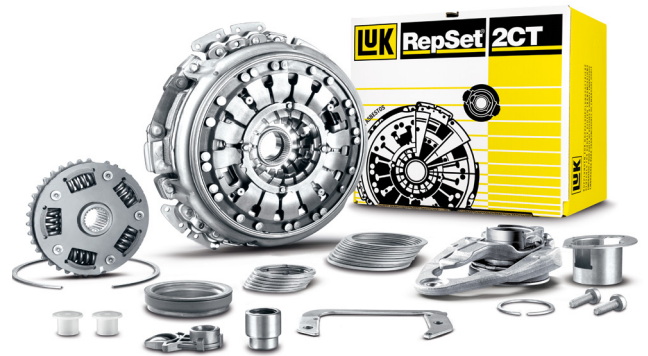
Kuva 2: LuK RepSet 2CT

Kaksoiskytkimen vaihdon yhteydessä on säädettävä aksiaaliset toleranssit irroitinlaakerien ja vipujousien välillä. Vaihteiston tyypistä riippuen sisältää LuK RepSet 2CT aluslevyt/kalotit kytkintä K1 varten tai säätöaluslevyt kytkintä K2 varten.